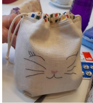
Workshop met Anne-Marie Blyaert