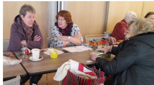
Koud in de zaal en toch was het een dag.