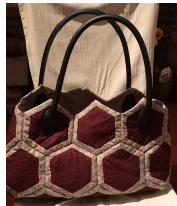
Monique De Boeck