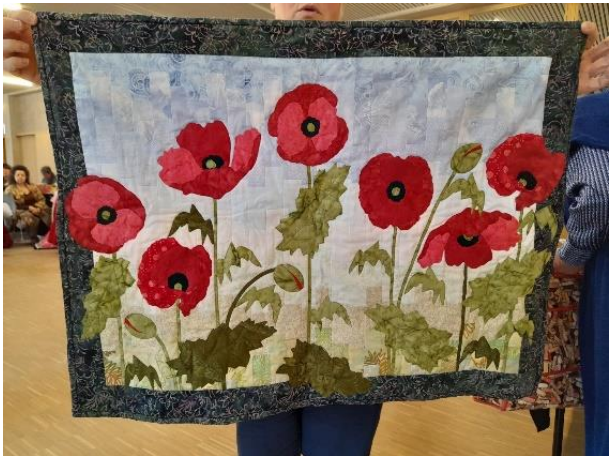
Els De Roos (workshop bij Diana (Hobby Patch))