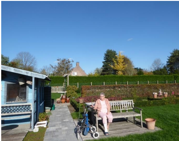
31.10.2020 herstellen van zware enkelbreuk!

Het is al enkele jaren dat ik zaag over een plaats in onze tuin waar we uit de wind en uit de zon kunnen zitten. Mijn voorstel om het tuinhuis om te vormen viel niet in goede aarde.