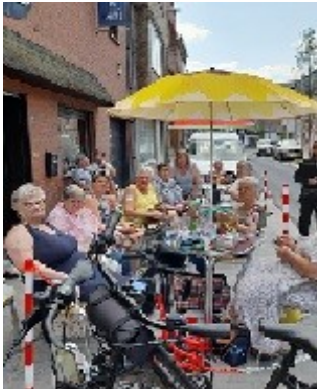
Terras, Toekomststraat 68, Cafe De Club.

Sinds juni komen we ook bij elkaar op de 2e zaterdag van de maand (kan in de loop van het jaar nog naar de 3 de veranderen).