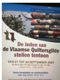
Drogenen : Tentoonstelling van de Vlaamse Quiltersgilde van 21 t/m 24 september.