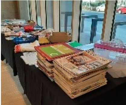
Tombola tafel 2023

De volgende Stadsdag zal plaatsvinden op de laatste zaterdag van februari, d.w.z. de 24e vanaf 10 uur. Het wordt een dag die in het teken staat van patchwork, met een winkeltje, een kleine workshop, een Show & Tell, een tombola en veel gezelligheid. Er komt ook nog een e-mail voor inschrijving in de komende weken. Kleine suggestie voor de tombola : denk alsjeblieft aan ons als je iets (patchwork) hebt dat je niet meer gebruikt, of het nu een lap stof is of een patroon, een oud boek, tijdschriften. Alles is welkom.