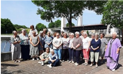
Groep op maandag

Het is ook mogelijk om elke dag te komen zonder overnachting.