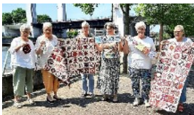
Dames bezig met een Dear Jane, Volgend jaar nog meer