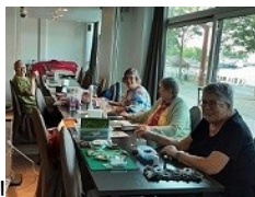
Eerste dames al klaar.

Een ander groot evenement van het jaar : QUIPDAY. Dit is een Europese openbare quiltdag, van 10.00 tot 18.00 uur. We zitten al enkele jaren op het plein van de Grote Markt in Vilvoorde, eerst in de bibliotheek en nu onder de luifel, beschermt tegen de regen of de zon.