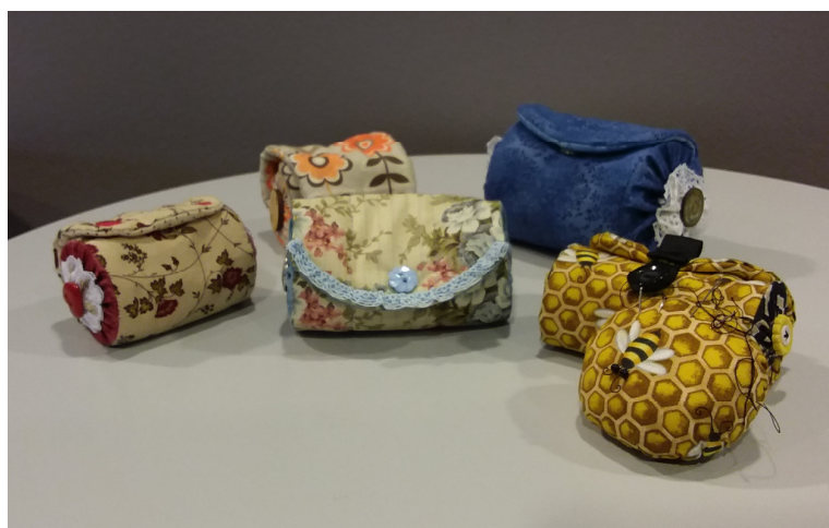
Foto hiernaast en onder een workshop garenhouders, gegeven door Bernadette Claeskens in ons Hobbyruimte in het Bolwerk te Vilvoorde.