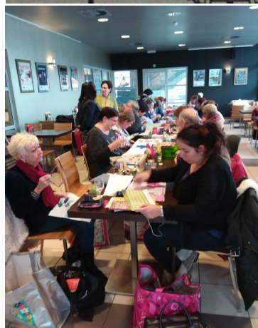
Sfeerbeelden in de Bobar